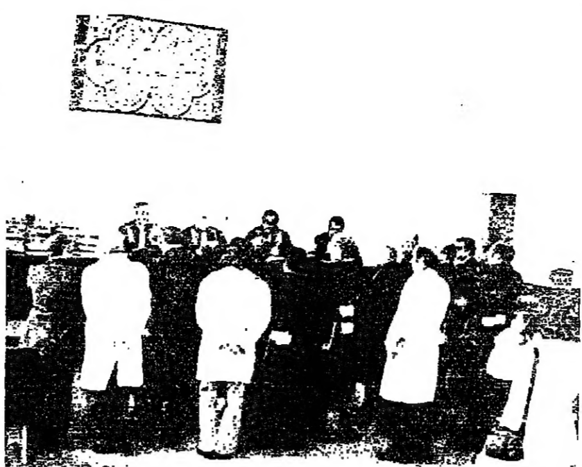
القضاة والمحامون في قصر العدل امس

وكان المحقق العلي قد اخلى سبيل شهوده ، وتم بيت عليهم شهده في هذه الجورين .